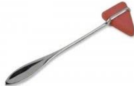
ไม้เคาะรีเฟล็กซ์