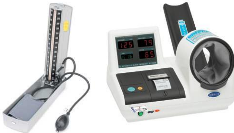
เครื่องวัดความดัน sphygmomanometer