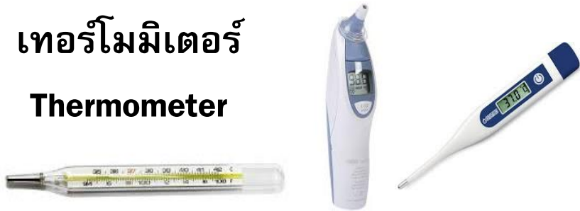
เทอร์โมมิเตอร์ Thermometer