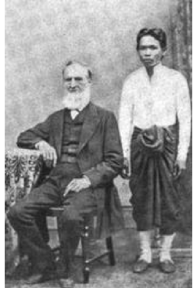
Dan Beach Bradley, M.D. นายแพทย์ชาวอเมริกัน